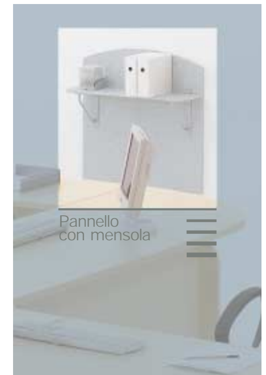
Pannello con mensola